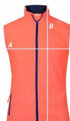
Medidas y tallas del Chaleco Técnico EVO